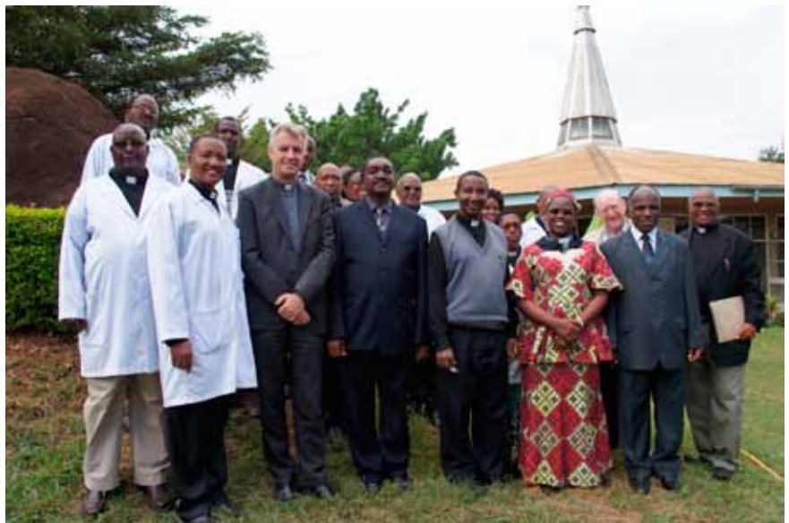
Die LWB-Delegation und Mitarbeitende des KCMC in Moshi.

Angesichts der Herausforderungen der Globalisierung appellierte Mlay an