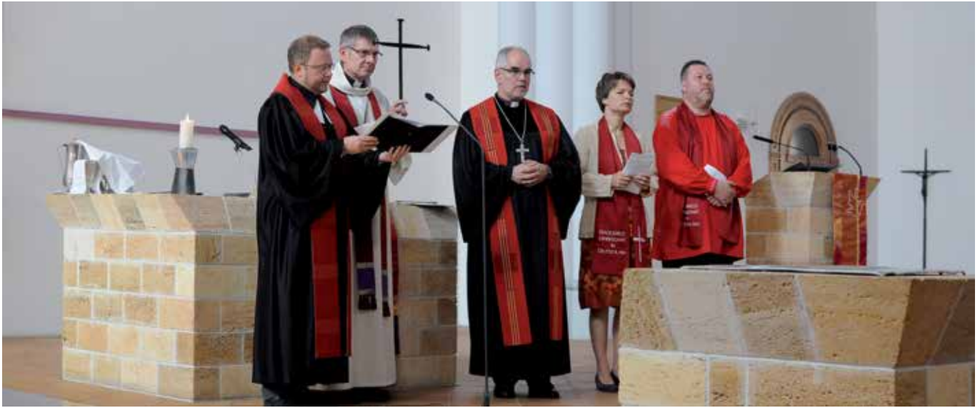
Die Vorstellung des Nagelkreuzes in Odessa