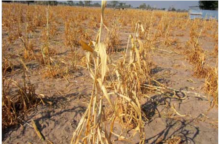
Verdorrt Hirse, Region Omusati (Nordnamibia).

Junge betonte, der besorgniserregenden Situation in beiden Ländern, die im Schatten grösserer Krisen weltweit Gefahr laufe, nur geringe Aufmerksamkeit zu erlangen, müsse frühzeitig Beachtung geschenkt und es müsse frühzeitig eingeschritten werden. „Aufgrund des Mangels an Nahrung und Wasser sind bei den Betroffenen Symptome von Unterernährung zu be-