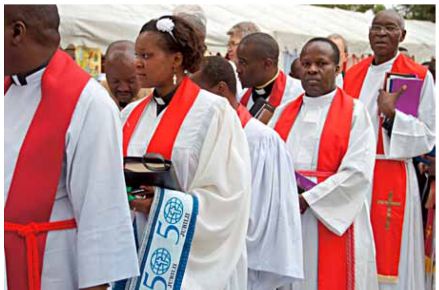
PfarrerInnen der ELKT bereiten die Prozession vor dem Festgottesdienst anlässlich des 50jährigen Bestehens der Kirche vor.

Die Feierlichkeiten fanden ihren Höhepunkt in einem Festgottesdienst am 23. Juni, der von ELKT-Mitgliedern, darunter aktive wie ehemalige BischöfInnen und PfarrerInnen aus dem ganzen Land, von internationalen Gästen aus Partnerkirchen und -organisationen, von VertreterInnen anderer Religionen sowie RegierungsbeamtInnen besucht wurde. Sieben Chöre und eine Blaskapelle trugen zur Lebhaftigkeit des sonntäglichen Gottesdienstes bei, im Rahmen dessen auch eine Publi-