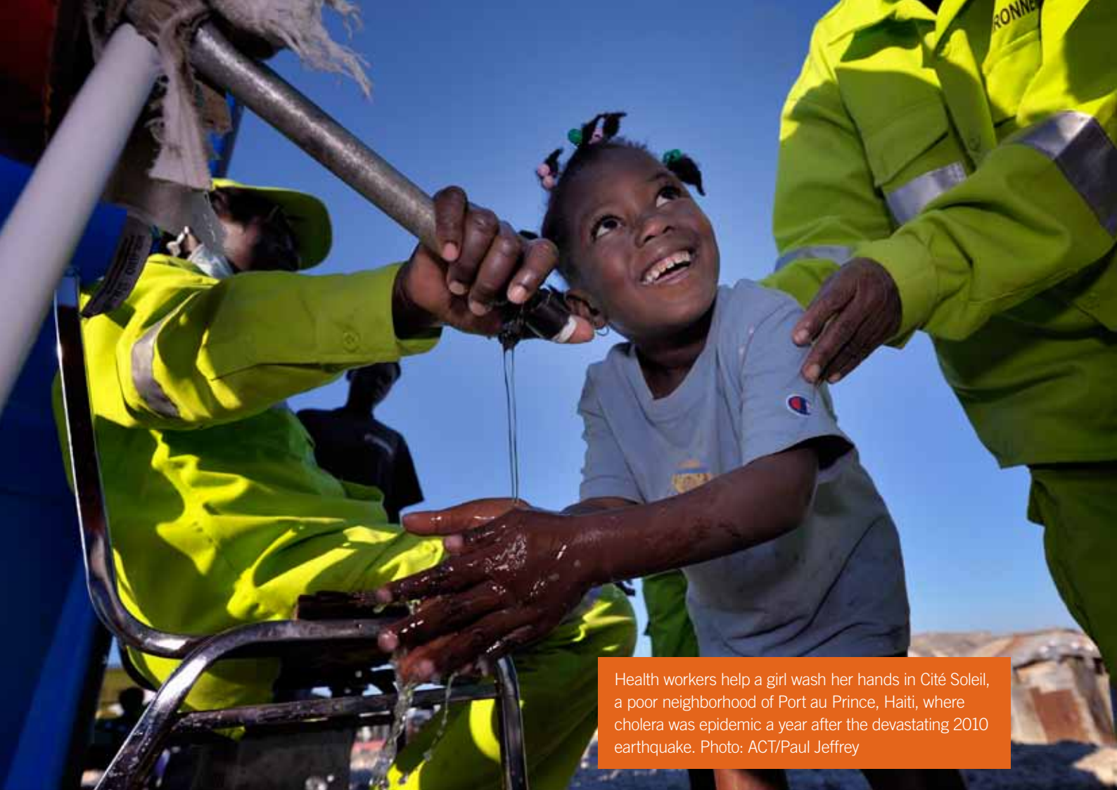
Health workers help a girl wash her hands in Cité Soleil, a poor neighborhood of Port au Prince, Haiti, where cholera was epidemic a year after the devastating 2010 earthquake.

violent outbreaks in Burundi, Yemen, Myanmar, the Central African Republic, Mali and the Lake Chad region which affected neighboring countries like Cameroon, Chad and Mauritania. The 50-year-old civil war in Colombia only came to a conclusion with a peace agreement and a ceasefire in 2016. Decades-old instability and conflict in other areas means that millions of people remain on the move or stranded for years as long-term IDPs or refugees. More than half of the world's refugees are children.