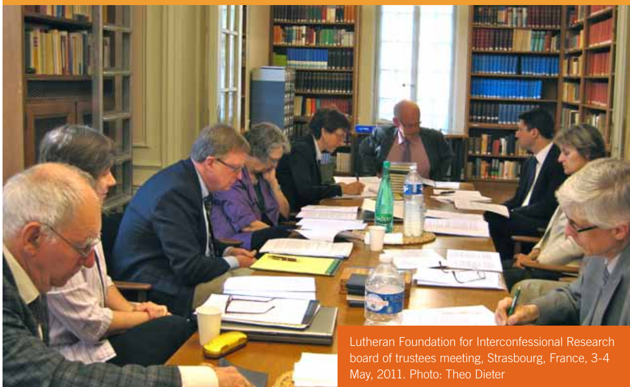
Lutheran Foundation for Interconfessional Research board of trustees meeting, Strasbourg, France, 3-4 May, 2011.