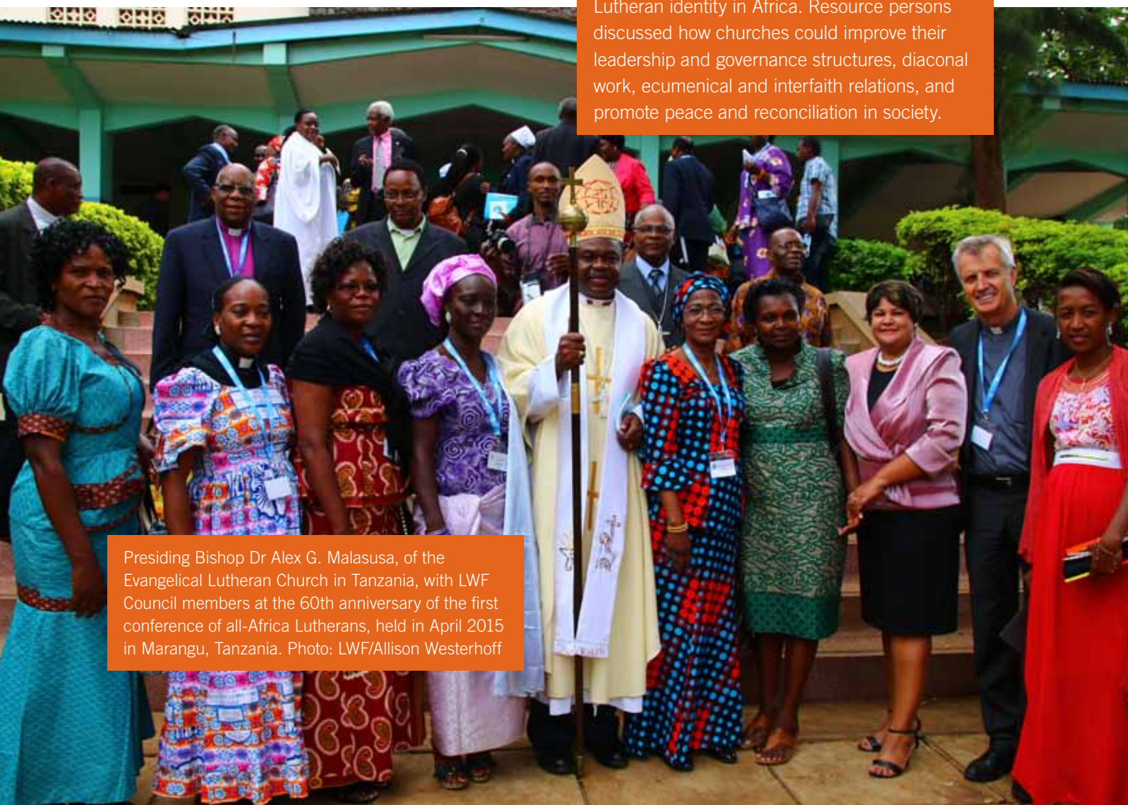
Presiding Bishop Dr Alex G. Malasusa, of the Evangelical Lutheran Church in Tanzania, with LWF Council members at the 60th anniversary of the first conference of all-Africa Lutherans, held in April 2015 in Marangu, Tanzania.

The theme of a reforming church enabled debate on what makes churches sustainable in order to strengthen the African region and the global LWF communion. Church representatives reiterated the urgent need to incorporate contemporary and practical approaches to theological education that help to build a strong Lutheran identity in Africa. Resource persons discussed how churches could improve their leadership and governance structures, diaconal work, ecumenical and interfaith relations, and promote peace and reconciliation in society.