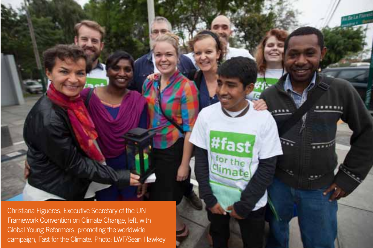
Christiana Figueres, Executive Secretary of the UN Framework Convention on Climate Change, left, with Global Young Reformers, promoting the worldwide campaign, Fast for the Climate.

The LWF played a key role in the preparation and adoption of the guidelines, which have been endorsed by religious leaders from Buddhist, Christian, Hindu, Jewish, Muslim, Sikh and other faith backgrounds.