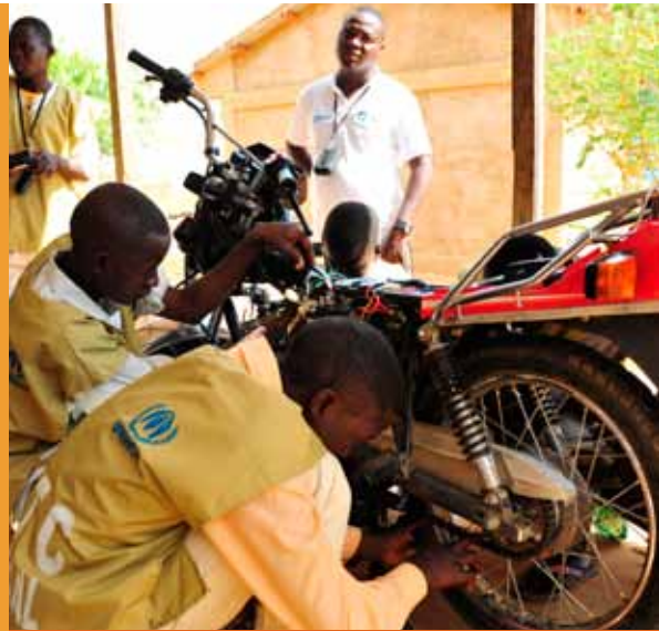
Students learn motorbike repair and maintenance at the LWF Vocational Training Center in Djabal, east Chad, December 2016.

Through vocational training projects, the LWF helps young people find lasting and valuable work. For example, more than 90 percent of graduates in automobile repair, carpentry, catering, craftwork, metalwork, plumbing, secretarial work and telecommunications from two vocational training centers in the Palestinian Territories, found employment in 2015.