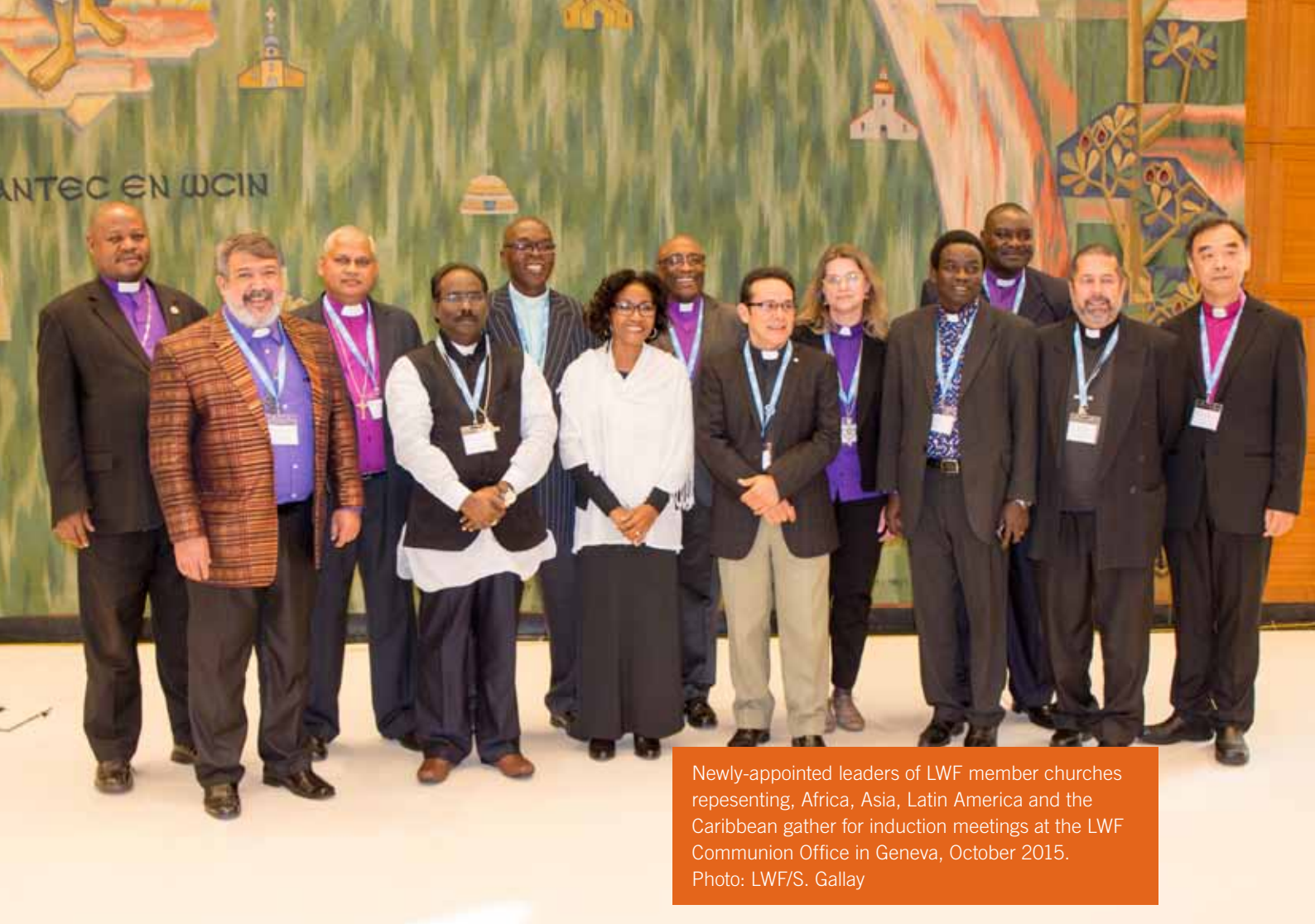
Newly-appointed leaders of LWF member churches representing, Africa, Asia, Latin America and the Caribbean gather for induction meetings at the LWF Communion Office in Geneva, October 2015.

In 2016, a group of 11 recently elected bishops and presidents affirmed the value of knowing more about the work of the communion. The retreat was an opportunity to learn about the various LWF programs and mutually empower each other as church leaders.