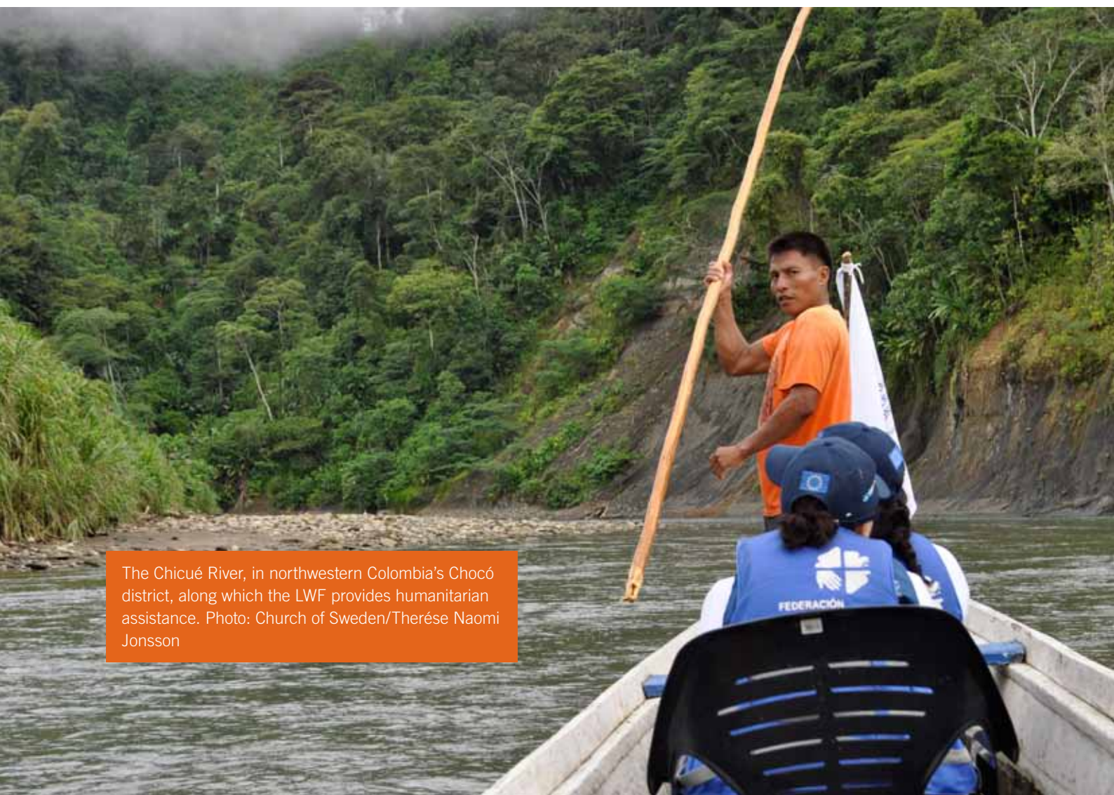
The Chicué River, in northwestern Colombia's Chocó district, along which the LWF provides humanitarian assistance.

Worldwide displacement is at the highest level ever recorded. Since the last LWF Assembly, the number of people forced to flee their homes had increased from 43.7 million to more than 60 million by the end of 2016. In the past seven years, we saw the start of armed conflict in South Sudan, in Syria and the Islamic State insurgency in northern Iraq. There were