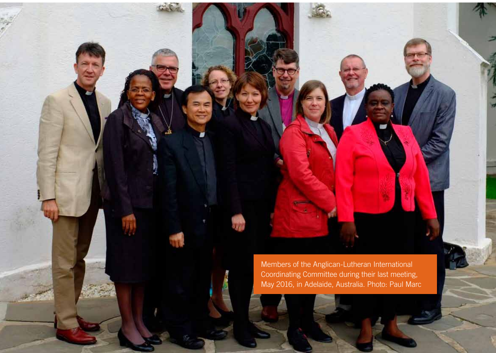
Members of the Anglican-Lutheran International Coordinating Committee during their last meeting, May 2016, in Adelaide, Australia.

Other platforms and relationship are important for the LWF’s engagement in joint witness. The World Council of Churches (WCC) has continued to be an important forum, and the good collaboration with the Faith and Order Commission and the Ecumenical Institute at Bossey make it easier to relate to and cooperate with other confessional families and wider