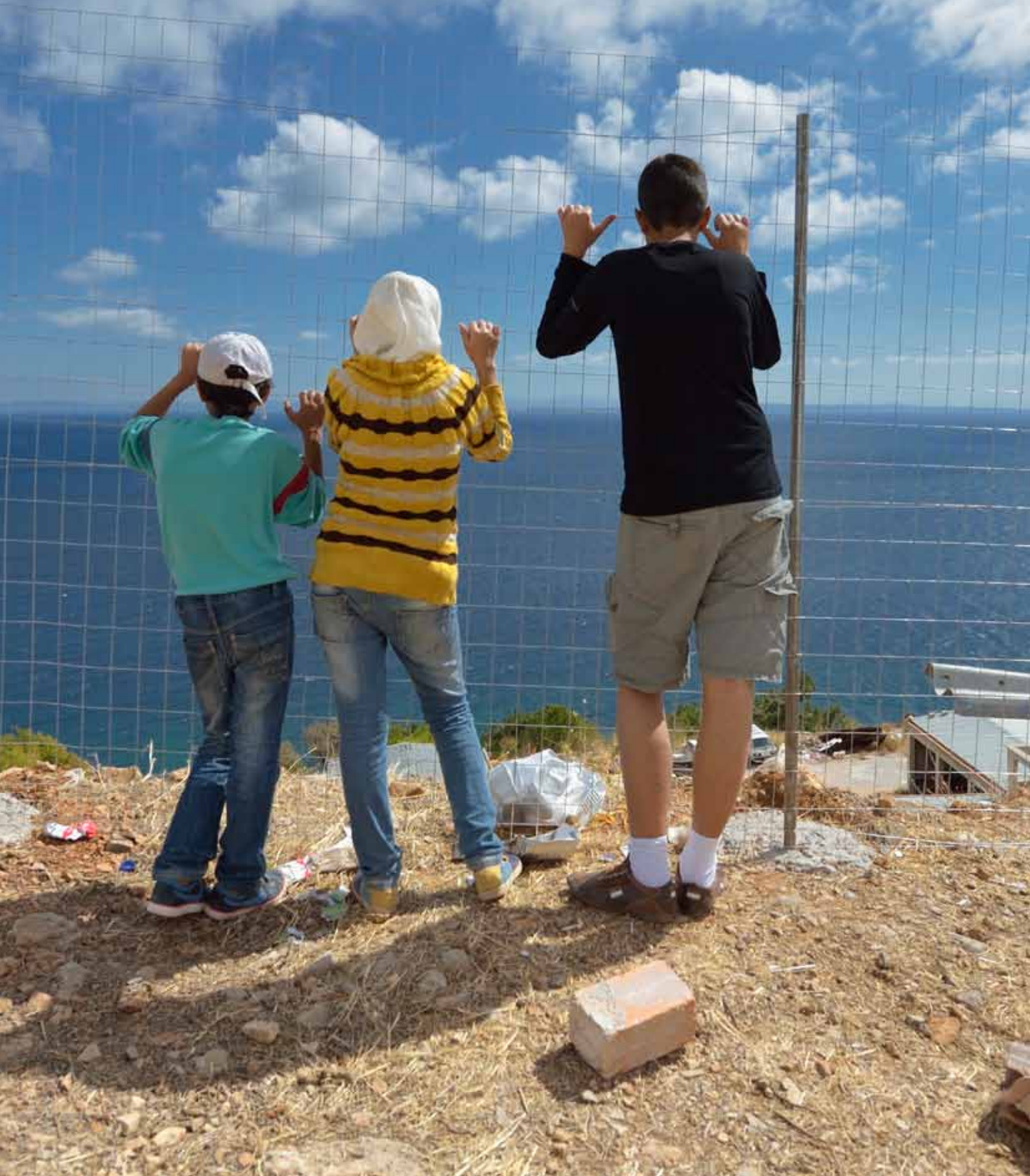
Syrian refugee children in Greece stand at a fence facing the Aegean Sea.