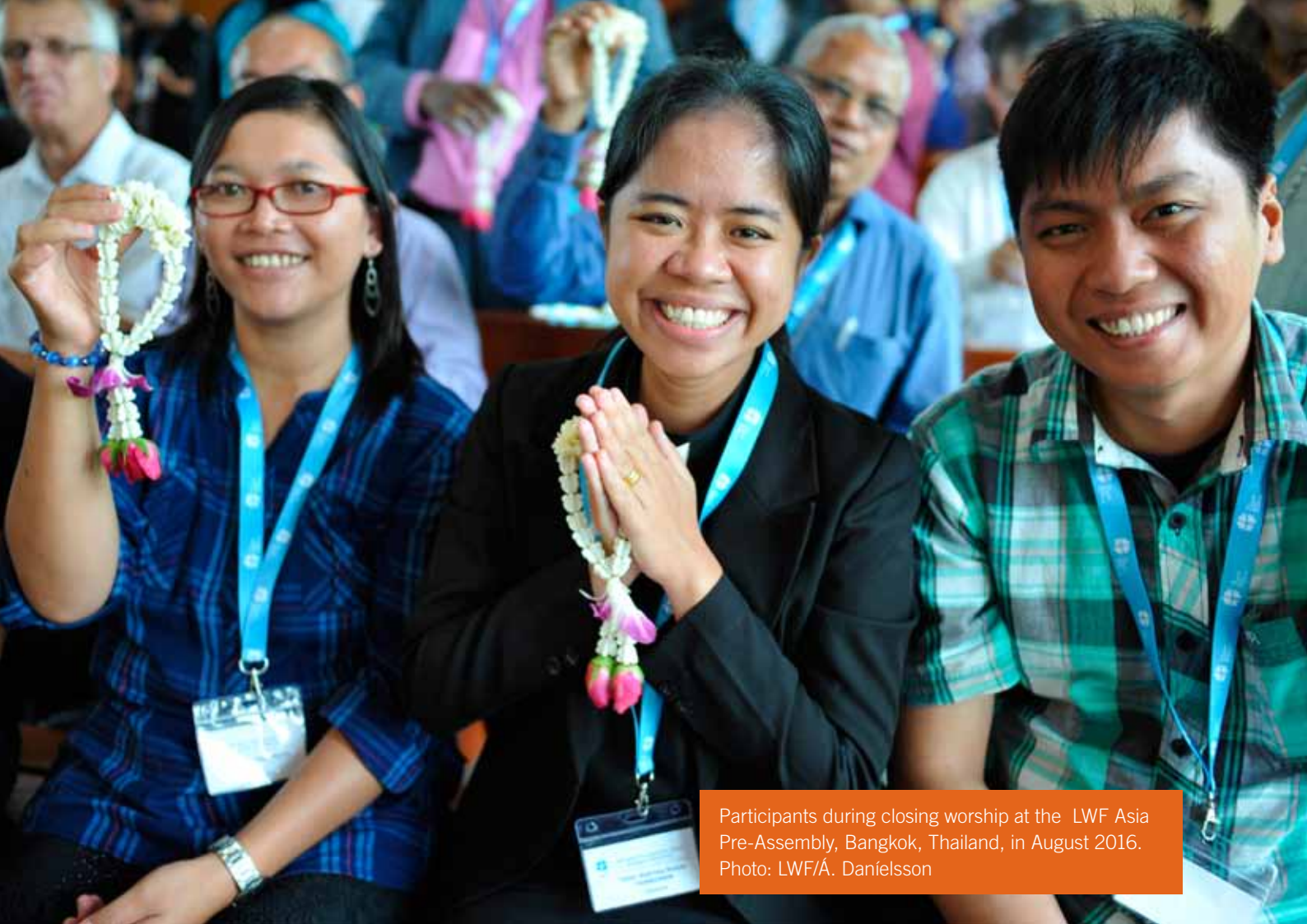
Participants during closing worship at the LWF Asia Pre-Assembly, Bangkok, Thailand, in August 2016.

support from Lutherans around the world,” Lone adds.