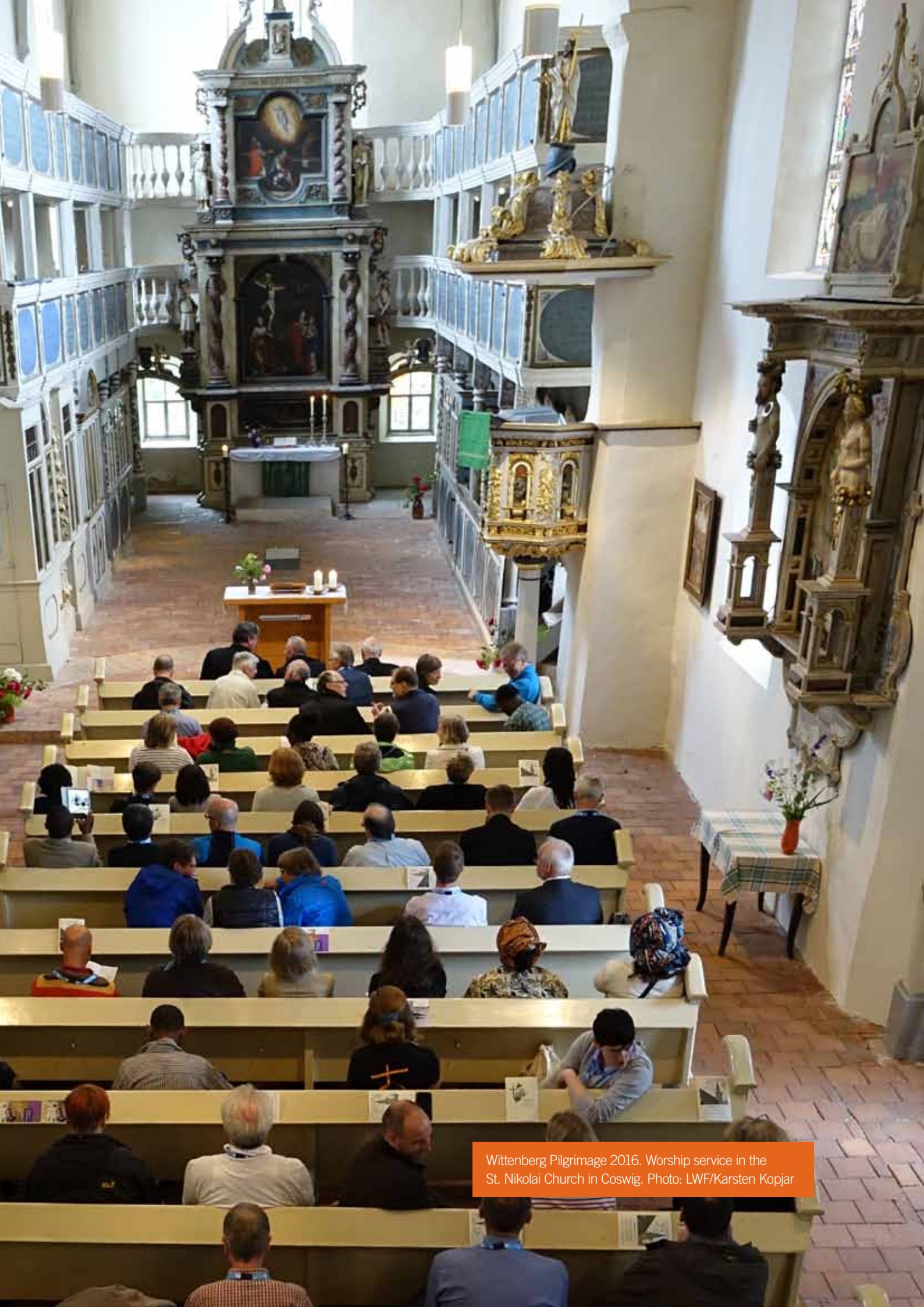
Wittenberg Pilgrimage 2016. Worship service in the St. Nikolai Church in Coswig.