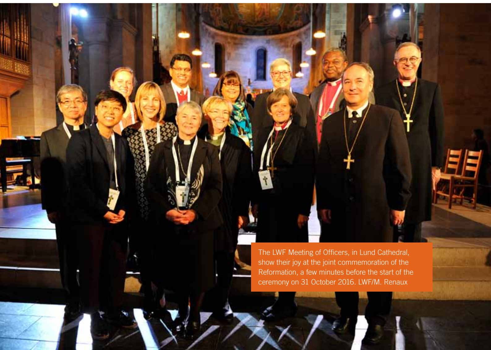
The LWF Meeting of Officers, in Lund Cathedral, show their joy at the joint commemoration of the Reformation, a few minutes before the start of the ceremony on 31 October 2016.

An initial orientation outlines principles of good governance, and new youth and women members