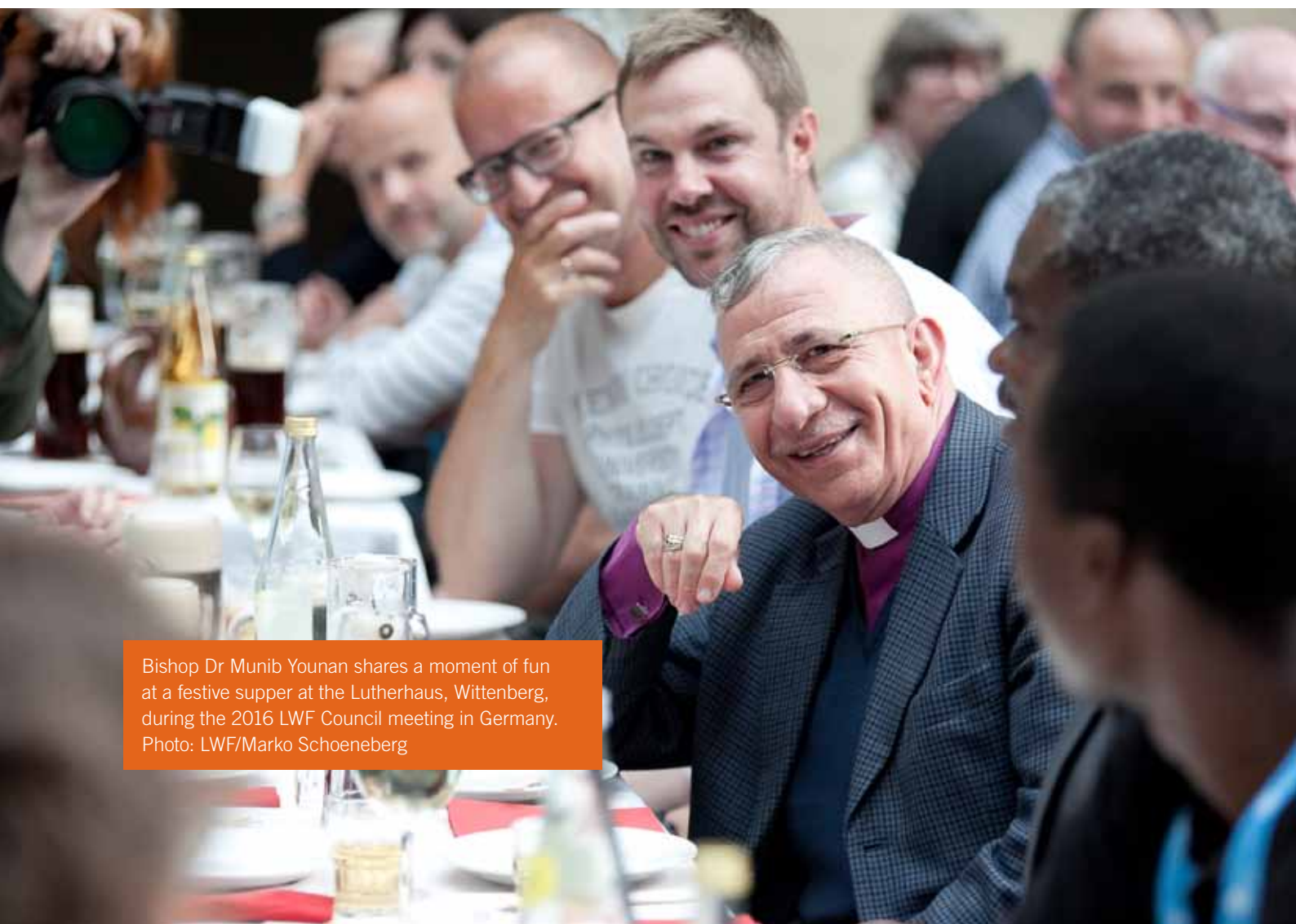
Bishop Dr Munib Younan shares a moment of fun at a festive supper at the Lutherhaus, Wittenberg, during the 2016 LWF Council meeting in Germany.

Refugees may lose many things as they flee but never their human rights. What is at stake today is the ongoing validity of instruments